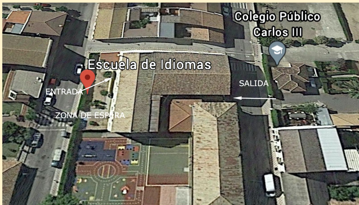
Vista general del edificio con acceso y salida indicados.